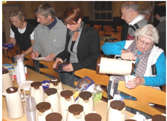
Der var gang i kaffe og kagen, og der var rigeligt – og det var godt.