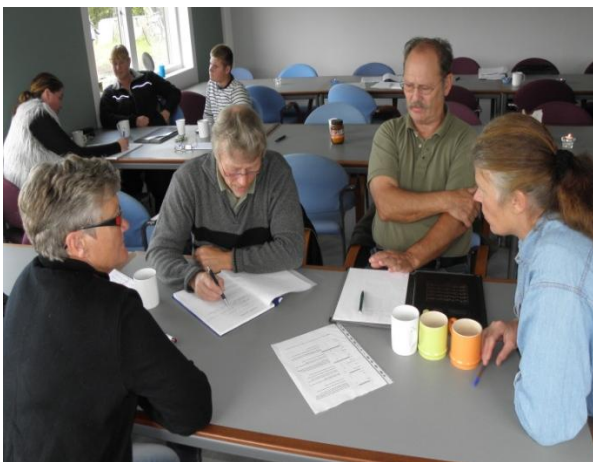
Der tænkes store tanker

Der er oceaner af muligheder til at give medlemmerne og andre de rigtige informationer, lige som klubben kan bruge hjemmesiden til nyhedsbreve og indbetaling af kontingent osv.