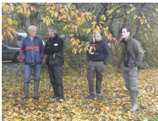
Der gives gode råd