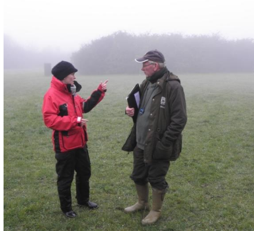
En dommer instrueres

Vejret var usædvanligt diset. Det gjorde det svært for de fremmødte at følge med i, hvad der sket ude på arealerne, men under alle omstændigheder viste vores hundeførere, at klubbens trænere har udført et stort stykke arbejde i løbet af sæsonen