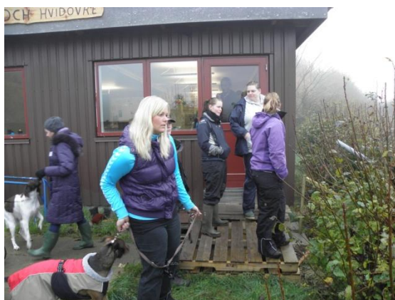
Der varmes op ved klubhuset