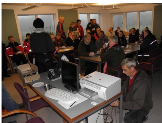
Christian var som sædvanlig en uundværlig hjælper.