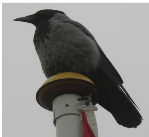
Mon de snart lægger et spor med god julemad?