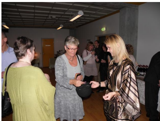
Lodtrækning om pladserne.

som påstod, at de havde spist halvdelen af deres mandel!