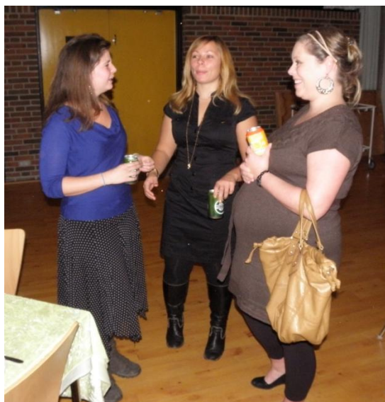
"Tøsesnak" om hvem, der havde spist mest?