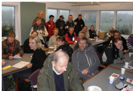
Spændte deltagere og hjælpere.

Vejret var usædvanligt diset. Det gjorde det svært for de fremmødte at følge med i, hvad der sket ude på arealerne, men under alle omstændigheder viste vores hundeførere, at klubbens trænere har udført et stort stykke arbejde i løbet af sæsonen